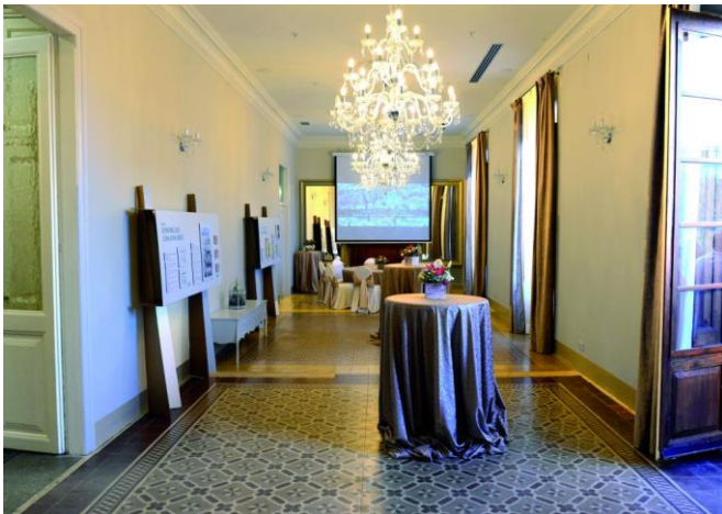
Imatge d'una de les sales de la planta noble, destinada a la celebració d'esdeveniments.