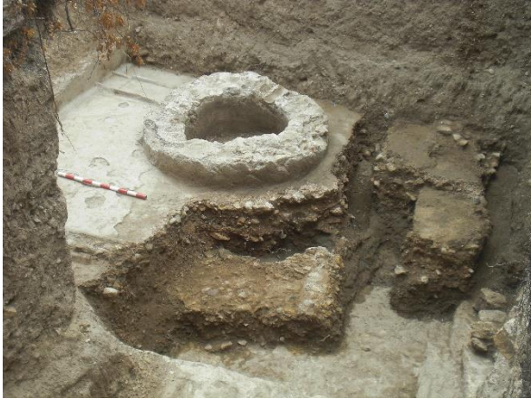
Detall del pou trobat al jardí, durant les obres d'adequació de l'escala d'emergència.

Durant les obres d'habilitació del jardí es va descobrir un antic pou o cisterna d'origen romà, contigu a les restes d'una cantera que proveïa blocs de pedra per a la construcció. A l'actualitat, aquest nou element es troba exposat al jardí, com un espai més d'interès a oferir als visitants de la casa.