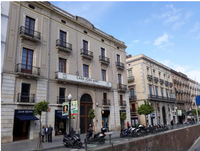
Detall de la façana principal de la casa, al costat de la veïna Casa Manuel Feliu.