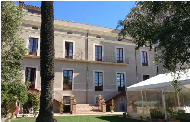
Detall de la façana posterior i part de la jardí de la casa.

El fet de trobar-se la casa en posició cantonera, amb tres façanes i jardí, provoca un enaltiment del conjunt arquitectònic. Un estil que deuria agradar i servir d'inspiració a la propietat veïna, la Casa Manuel Feliu (Rambla Nova nº38), construïda l'any 1862.