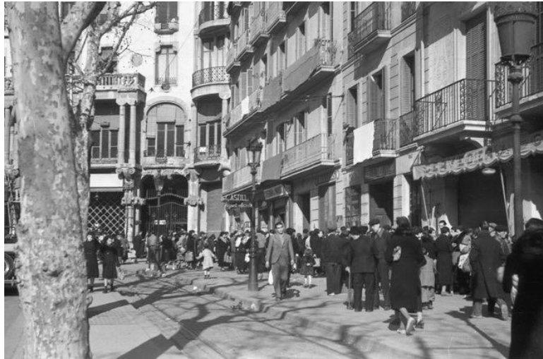
Cua per aconseguir aliments de l'Auxilio Social a la Casa Fuster

L'any 1939, un cop acabada la guerra i desaparegudes les organitzacions pro-republicanes, la Falange Española va ocupar la planta principal. En aquells anys, part de l'edifici també va ser la seu de l'organització franquista Auxilio Social.