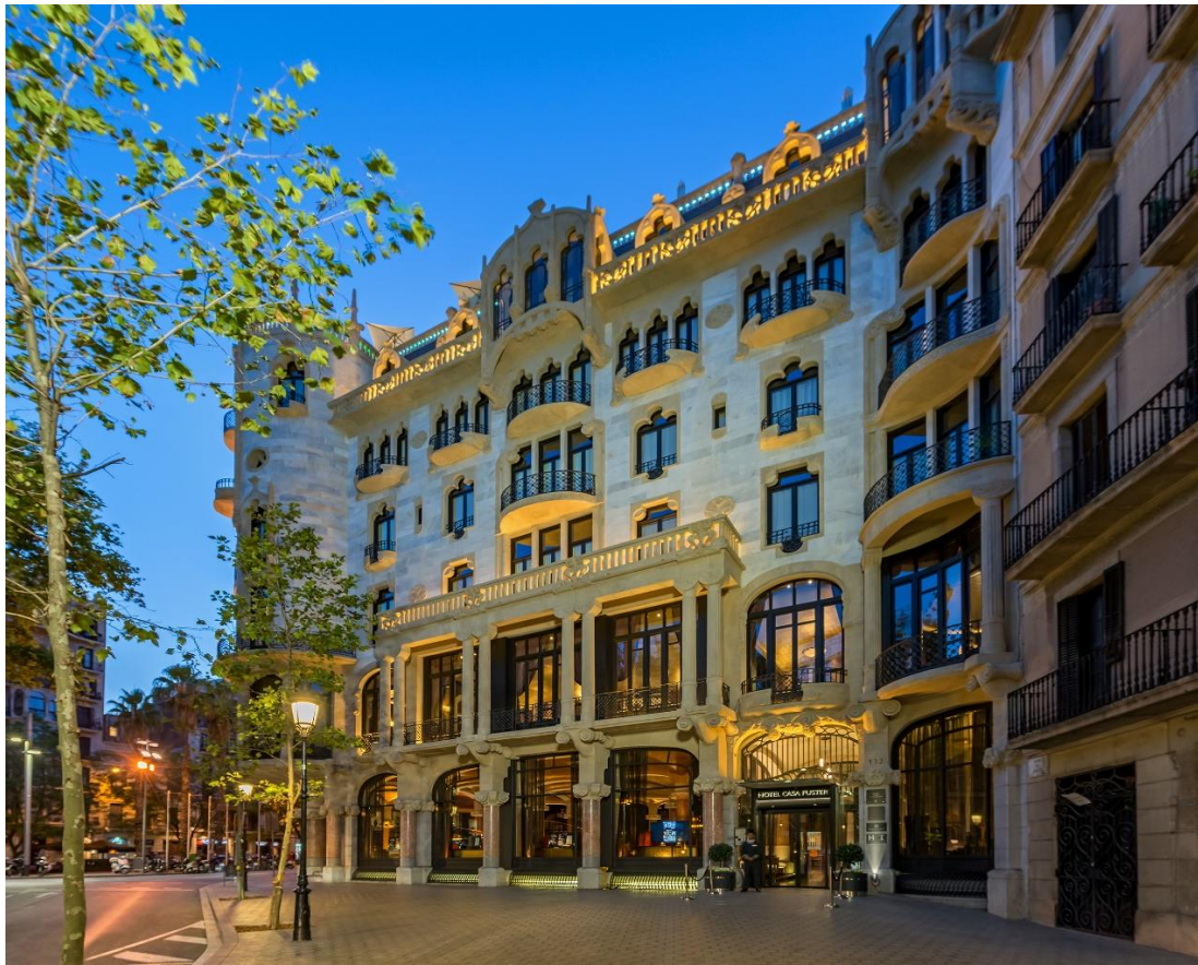
Entrada a l'Hotel Casa Fuster

Una vegada acabada aquesta important i respectuosa rehabilitació, a l'any 2004 es va inaugurar l'actual Hotel Casa Fuster, pel que es va poder tornar a obrir l'històric Cafè Vienès, avui de plena actualitat, per ser punt de trobada i reunió d'artistes i intel·lectuals, presentacions de llibres, entrevistes a gent coneguda, i sobretot pels exitosos concerts de música que s'hi organitzen setmanalment. Aquest espai ha tingut molts "visitants il·lustres", però potser el més mediàtic ha estat en Woody Allen quan hi va fer nombroses actuacions amb el seu clarinet i acompanyat de dos dels seus músics, durant els tres mesos que va durar el rodatge de la pel·lícula Vicky Cristina Barcelona. De fet, ell mateix va fer modificar el guió de la pel·lícula, per a que hi pogués aparèixer una escena rodada al Cafè Vienès on ell havia tocat.