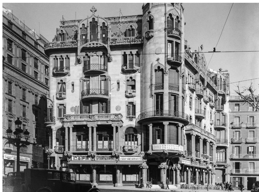
Façana de la Casa Fuster

L'any 1932 s'instal·laren les oficines provisionals del Partit Català d'Acció Republicana al pis principal, i el 1933 l'Istituto Italiano di Cultura. Aquell mateix any, un senyor alemany que tenia un petit bar a la plaça del davant, i que se li havia quedat petit, va llogar tot el local de la planta baixa, i hi va inaugurar el Cafè Vienès (el nom li venia donat perquè aquest ampli local es va decorar amb cadires d'estil vienès, potser més conegudes com a cadires Thonet). De seguida el Cafè Vienès es va convertir en un lloc important de trobada d'artistes i de nombroses i animades tertúlies literàries.