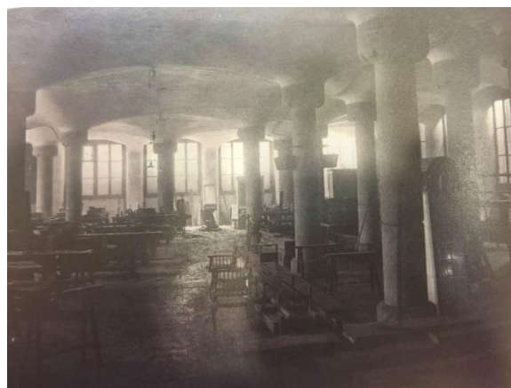
Local en el soterrani on es fabricaven els mobles