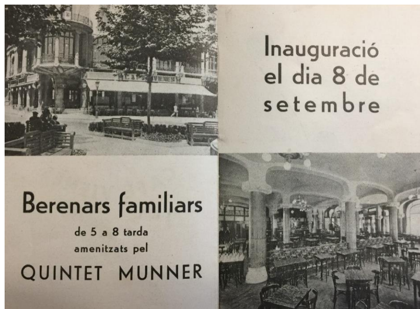
Fotos de la inauguració del Cafè Vienès

En el soterrani del Cafè Vienès, el mateix senyor alemany hi va inaugurar la sala de ball anomenada Danubi Blau. En aquest saló hi tocava l'Orquestra Florida, mentre "estudiants, soldats i jovenetes ballaven entre columnes modernistes".