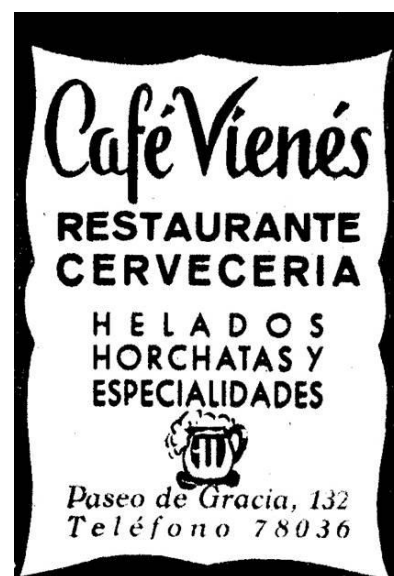
Anunci del Cafè Vienès

A la primera planta també hi va haver el Consolat Alemany fins el 1936. L'esclat de la guerra civil va influir per a que aquell mateix any, el POUM (Partit Obrer d'Unificació Marxista) va apoderar-se del pis principal on hi havia l'Istituto Italiano, i hi va ubicar la seu de les Joventuts del POUM. Aquella mateixa planta també va servir a l'any 1937 per a constituir-hi el Comitè de Defensa per a la Revolució, impulsat per la Joventut Comunista Ibèrica, la CNT, la FAI i les Joventuts Llibertàries. Amb l'arribada de la guerra, el tercer pis va ser ocupat pel Socors Republicà.