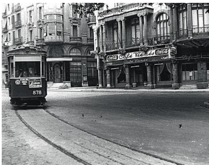
L'entrada originaria al Cafè Vienès