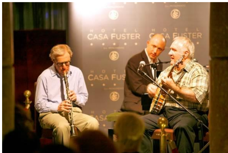
Woody Allen en el Cafè Vienès

Una vegada acabada aquesta important i respectuosa rehabilitació, a l'any 2004 es va inaugurar l'actual Hotel Casa Fuster, pel que es va poder tornar a obrir l'històric Cafè Vienès, avui de plena actualitat, per ser punt de trobada i reunió d'artistes i intel·lectuals, presentacions de llibres, entrevistes a gent coneguda, i sobretot pels exitosos concerts de música que s'hi organitzen setmanalment. Aquest espai ha tingut molts "visitants il·lustres", però potser el més mediàtic ha estat en Woody Allen quan hi va fer nombroses actuacions amb el seu clarinet i acompanyat de dos dels seus músics, durant els tres mesos que va durar el rodatge de la pel·lícula Vicky Cristina Barcelona. De fet, ell mateix va fer modificar el guió de la pel·lícula, per a que hi pogués aparèixer una escena rodada al Cafè Vienès on ell havia tocat.