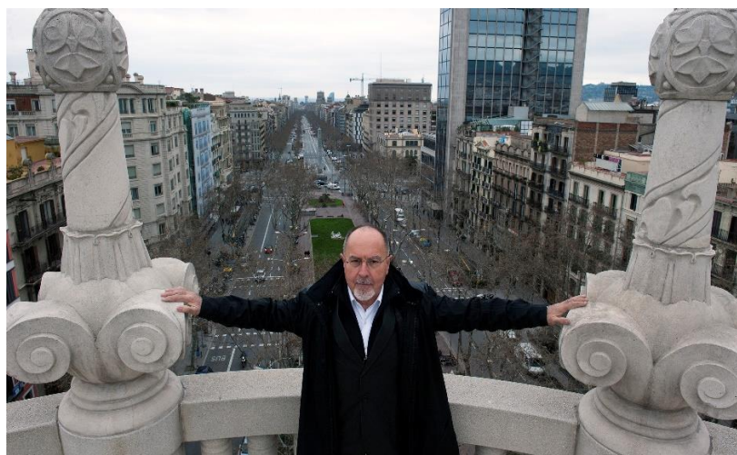
Vistes des de la terrassa i, per cert, aquesta és la última foto en vida i en un lloc públic, que se li va poder fer al director de cine Bigas Luna