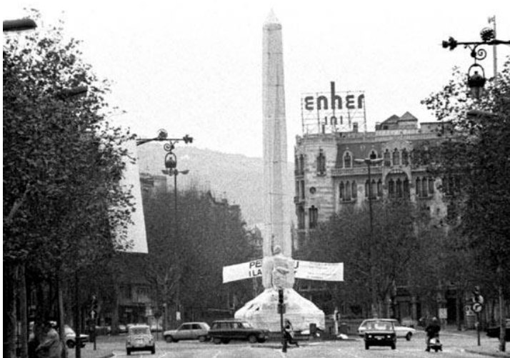
Rètol de l'ENHER a la terrassa de la Casa Fuster