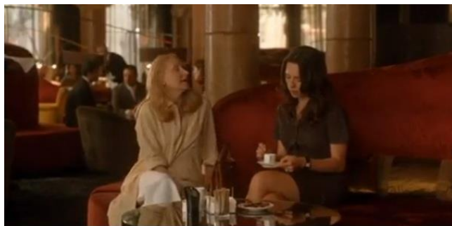
Escena gravada al Cafè Vienès

Actualment, i a la primera planta també hi podem trobar el Panot Restaurant, dirigit per Marc Ribas, el conegut xef i presentador de T.V. que, amb un concepte de cuina tradicional burgesa inspirada en l'època modernista, ens fa gaudir del millor de la cuina catalana.