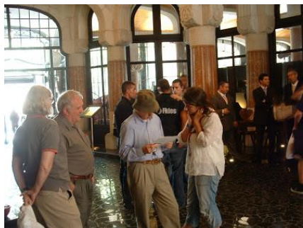
Rodatge de la pel·lícula