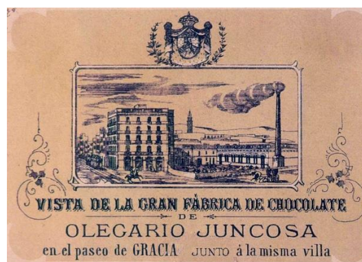
Fàbrica xocolates Juncosa

No va ser fins a finals de l'any 1911, quan van finalitzar les obres de la seva construcció i la família Fuster-Fabra (el matrimoni amb el seus quatre fills) s'hi van poder traslladar a viure. Com s'acostumava a fer en aquella època, la família propietària s'instal·lava a la planta principal de l'edifici (actual primer pis), i disposaven de la resta de l'edifici per a llogar, i així poder contribuir a liquidar les despeses del manteniment de tot l'edifici, amb les rendes obtingudes dels lloguers.