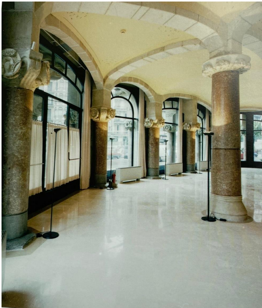
Sala exposicions ENHER

A l'any 1994 es va poder recuperar l'espai del Cafè Vienès per a ús públic, i s'hi va inaugurar una sala d'exposicions de la pròpia ENHER.